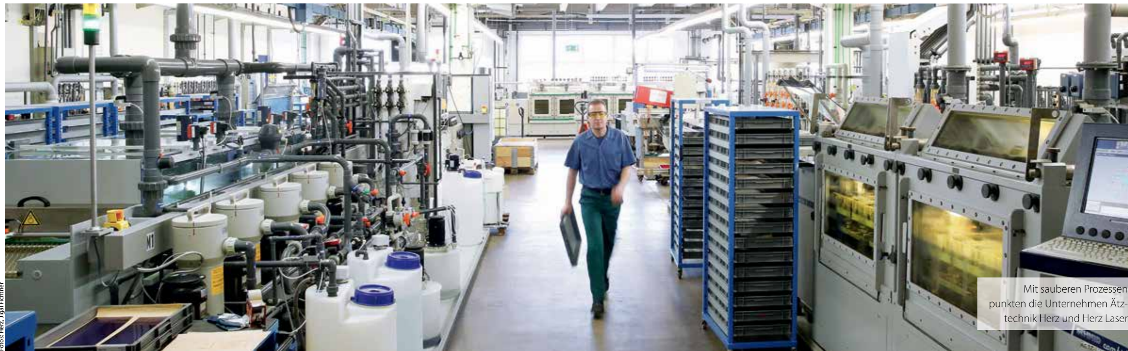
Mit sauberen Prozessen punkten die Unternehmen Ätztechnik Herz und Herz Laser

Ätztechnik Herz GmbH & Co. KG Industriegebiet Kilbigswasen 4 78736 Epfendorf am Neckar info@aetztechnik-herz.de www.aetztechnik-herz.de Telefon: 074 04/92 14-0 Telefax: 074 04/92 14-30