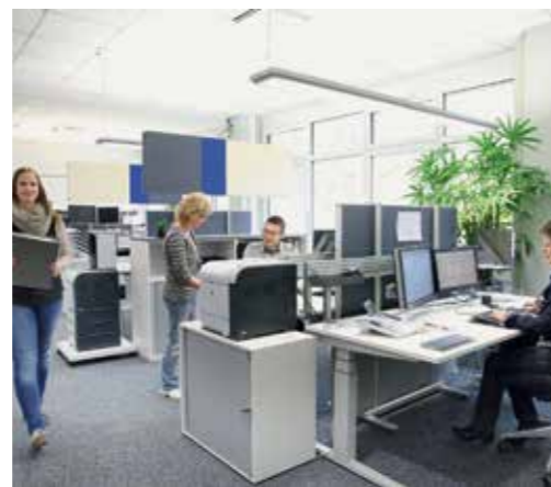
Alle Arbeitsplätze sind gleich hochwertig ausgestattet

Denn das Familienunternehmen ist in den 40 Jahren des Bestehens zum Primus der Branche geworden. Pro Jahr werden rund 16 000 Artikel mit 37 Millionen Teilen gefertigt. Feinste Federn und Strukturen für unterschiedlichste Anwendungen von Fahrzeugen bis zu Rasierapparaten entstehen bei Herz Ätztechnik – aber auch schon mal Geländer für den Star-Architekten Sir Norman Foster.